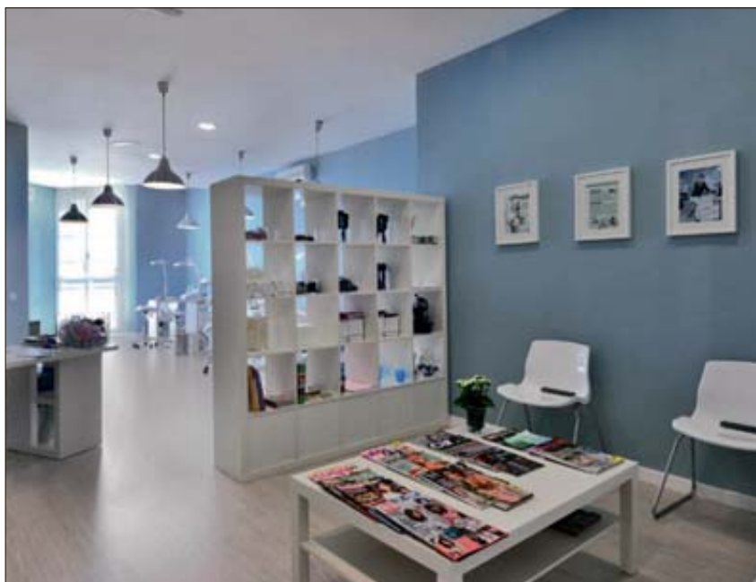
HEAD CLEANERS. Su tratamiento se realiza en una sola sesión de hora y media de duración.

Su tratamiento, basado en la más avanzada tecnología y en línea con las prácticas de las más prestigiosas clínicas internacionales, se lleva a cabo en una sesión de aproximadamente una hora y media de duración que se divide en tres fases, realizando un peinado para eliminar los piojos y las liendres con lencerías de aspirado diseñadas en exclusiva para Head Cleaners, un posterior repaso de las distintas secciones con lencerías especiales, utilizando potentes lámparas y lentes de aumento, y un repaso final de cada uno de los mechones que se hace manualmente para comprobar la completa desaparición de las liendres. Y todo sin la menor molestia, con el afectado cómodamente sentado en un sillón de masaje mientras navega por Internet a través de una tablet , juega con la consola o se distrae con una película en DVD. Solo hay que regresar una vez, siete días después, para pasar una re-